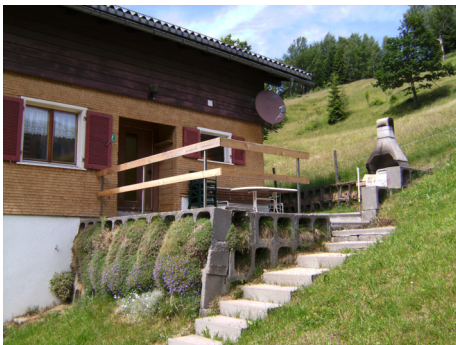
Sonnenterrasse mit Grillkamin