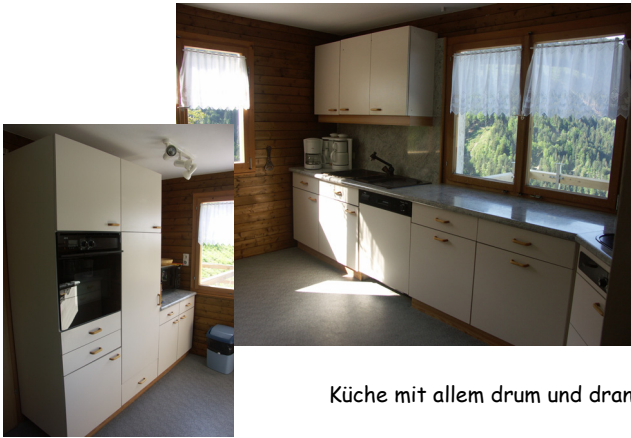
Küche mit allem drum und dran